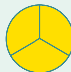
A3_Lang (> 15 maanden)