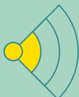
B1_Licht (ver onder norm, weinig tot geen verkeershinder)