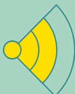
B2_Matig (onder de norm, enige verkeershinder)