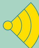
B3_Zwaar (geregeld tegen de norm, substantiële verkeershinder)