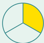
A1_Kort (< 3 maanden)